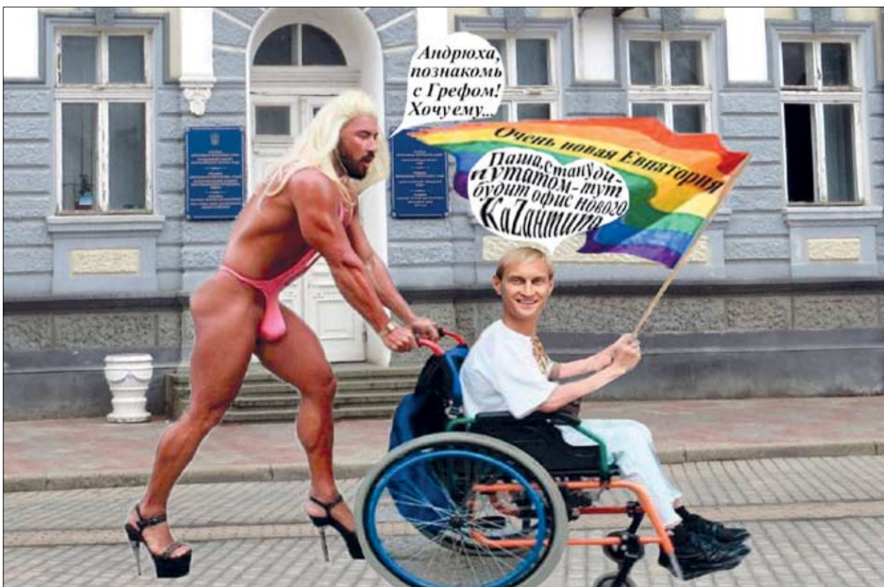
«Ну, за новый круглогодичный и круглосуточный «Казантип» на... Театральной площади!»