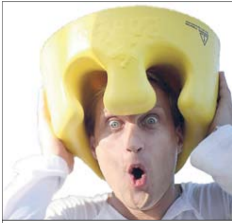
«О, класс! Снова к Нине на поруки!»

стоящее время «Колизей» - авт.), возбужу в отношении тебя уголовное дело за кражу денежных средств коммунального предприятия «Молодежный центр труда».