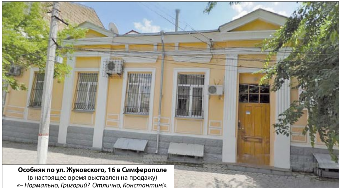
Обособняк по ул. Жуковского, 16 в Симферополе (в настоящее время выставлен на продажу) «– Нормально, Григорий? Отлично, Константин!».

Спрашивать у Куницына сколько это стоит, затае напрасная, потому обратимся к «свежему» объявлению от 08:58 13 июня 2013г., в котором соседний аналогичный особняк (только крыша зеленого цвета) выставлен на продажу за каких-то 1.890.000 долларов США . «– Нормально, Григорий? – Отлично, Константин!».