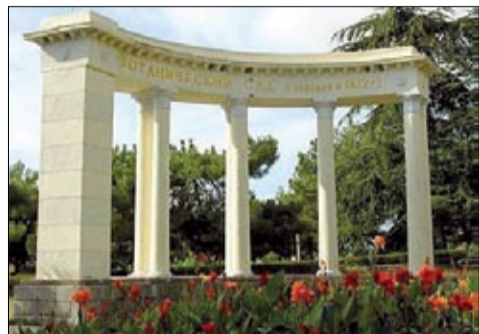
Южный берег Крыма – вход в Никитский ботанический сад.

Потом, уже 21.10.2010г., Указом Президента Украины внесли изменения в Указ об увольнении №958 от 13.10.2010г., дополнив его словами: «в связи с поданным заявлением об отставке в соответствии со статьей 31 ЗУ «О государственной службе». Тогда подумал, это ж надо: при Кучме работал, при Ющенко-Тимошенко работал, а с Януковичем как-то не очень получается. Сколько партий сменил: КПСС , « Союз в поддержку Республики Крым », « НДП »,