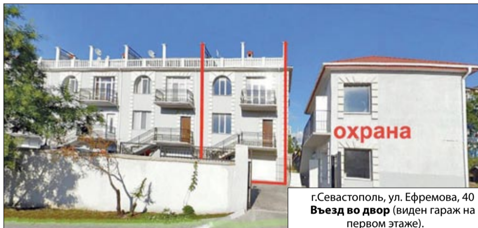
г.Севастополь, ул. Ефремова, 40 Въезд во двор (виден гараж на первом этаже).