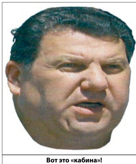
Вот это «кабина»!