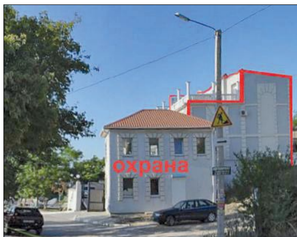
Вид, с торца, дома по ул. Ефремова, 40 с 8 –ю 4-комнатными 4-этажными квартирами.

Но получается так, как получается. Во время своего севастопольского губернаторства Куницын почти ежедневно передвигался с