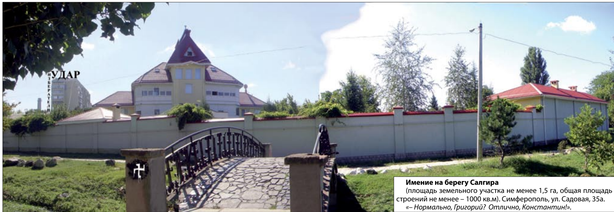
Имение на берегу Салгира

Уже после выхода на свободу, полного моего оправдания в суде, награждения Указом Президента Украины от 23 февраля 2010г. орденом «ЗА МУЖЕСТВО» (вручен 17.03.2010г.) через несколько дней узнал, что Куницына... «попросили» и с должности губернатора Севастополя. А через несколько месяцев, 13.10.2010г., без объяснения причин и пово-