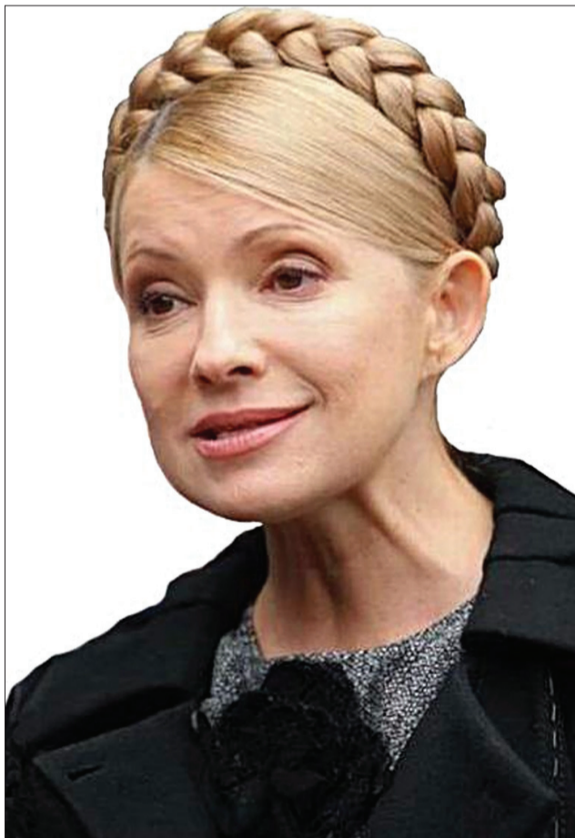
Тимошенко Ю. Когда Юлия Владимировна говорит о президентах и Фирташе, она выглядит непривычно органично...

тельман) Юлия, ее надежный и проверенный в делах партнер Турчинов Александр и, конечно, обязательно, Яценюк Арсений (Писая). Все остальные явно находятся на подхвате у этой тройки.