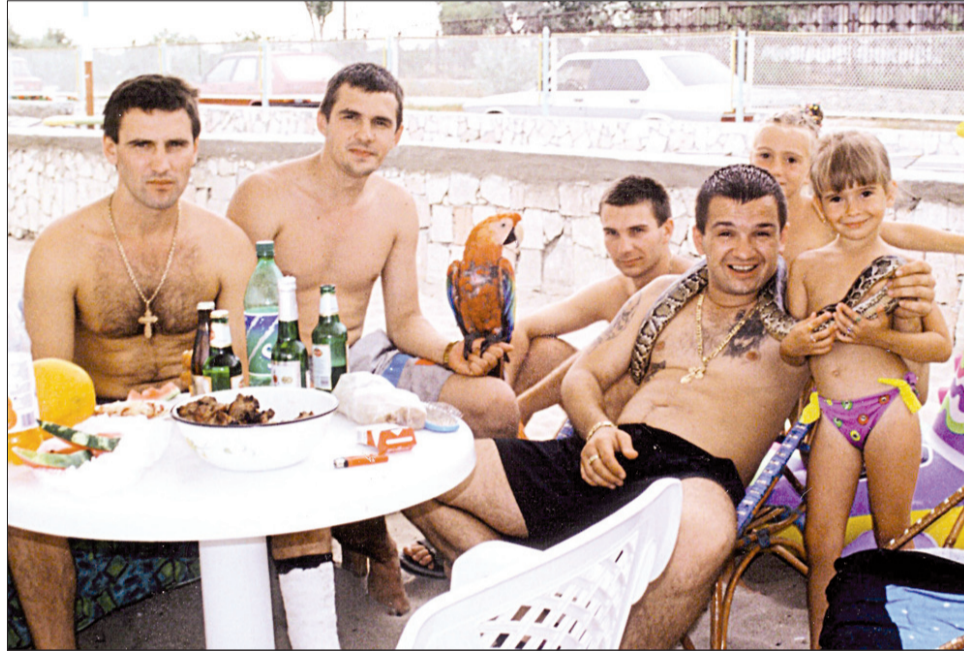
«Бригада» в редкие минуты отдыха от «дел».

В связи с установленным указанным подлогом в избирательных документах прокуратура Евпатории (смотри Петер Г.) по указанию прокуратуры АР Крым направила представление в Евпаторийс-