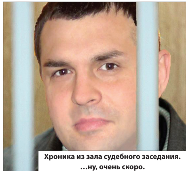
Хроника из зала судебного заседания. ...ну, очень скоро.

И «Да свершится правосудие» («Fiat justitia» - латынь).