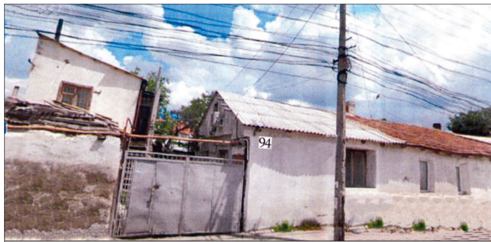
Здесь «пацаны нормальные» чуть не получили свое первое высшее образование

Поскольку накануне очередная сходка закончилась далеко за полночь, сразу попасть в заветное помещение «института» не получилось. Прибыв на указанную улицу и не представляя себе, как на самом деле может и должно хотя бы внешне выглядеть помещение ВЫСШЕГО УЧЕБНОГО ЗАВЕДЕ-НИЯ, «коллеги», перепутав номера, попытались пройти во двор домовладения № 94.