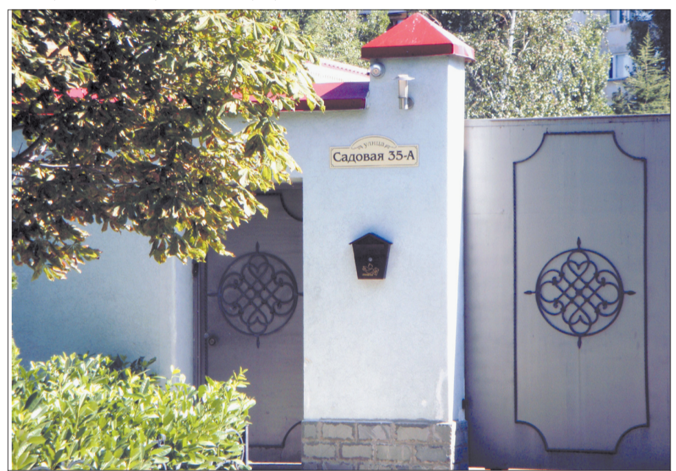
Центральный вход в имение

А Кличко, почему-то жаль. И зачем ему обманывать свой народ?