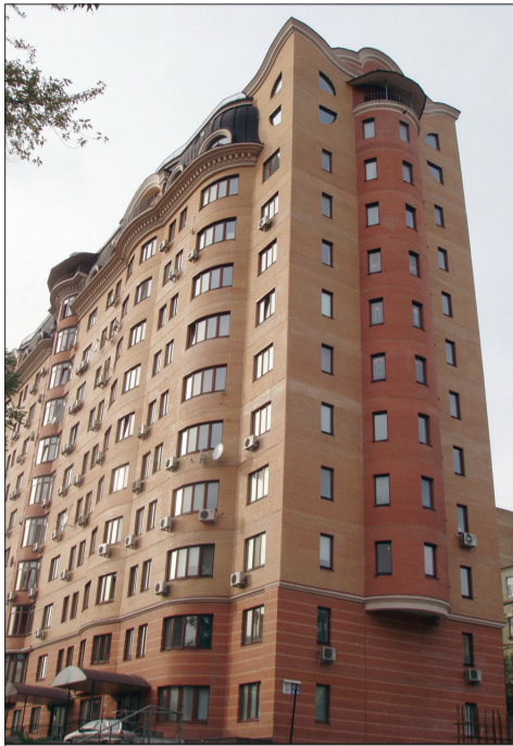
Дом 30-а по ул. Жиланской в г. Киеве