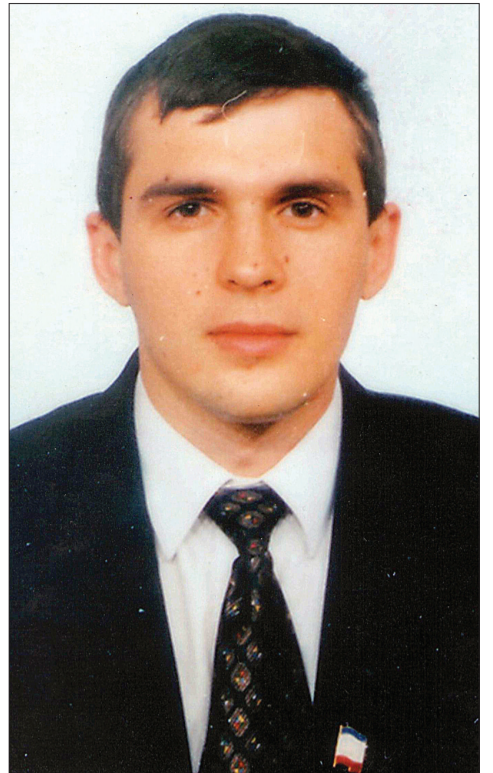
Май 1996 г. Колян в первый раз стал депутатом Евпаторийского горсовета Правое ухо еще свое

- массивный золотой браслет, состоящий из скрепленных между собой золотых пластин, весом 60 грамм;